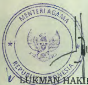
LUKMAN HAKIM SAIFUDDIN

MENTERI PENDAYAGUNAAN APARATUR NEGARA DAN REFORMASI BIROKRASI,